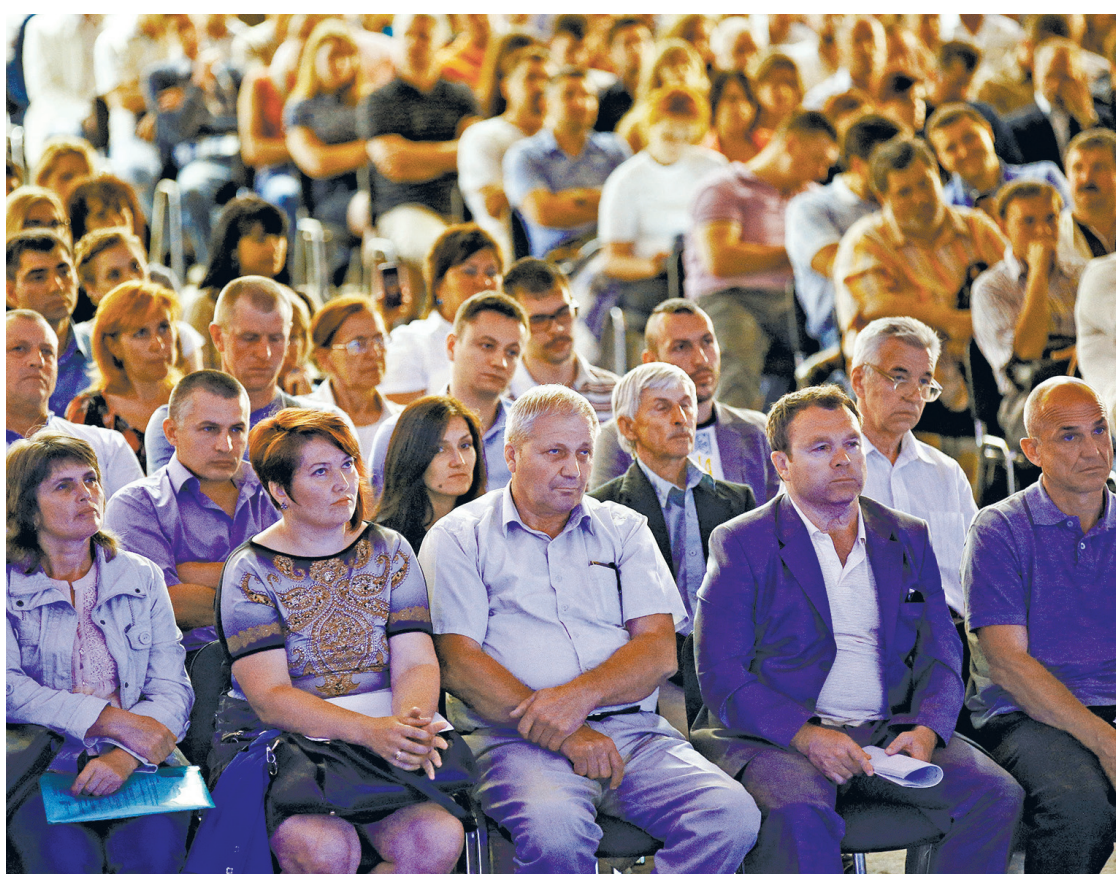
Понад 1100 однодумців з Одеси, Вінниці, Полтавщини, Рівненщини, Івано-Франківщини, Львівщини, Запоріжжя, Кіровограду, Донецька, Дніпропетровська, Волині, Луганська, Чернівців, Києва взяли участь у презентації партії «ВОЛЯ»