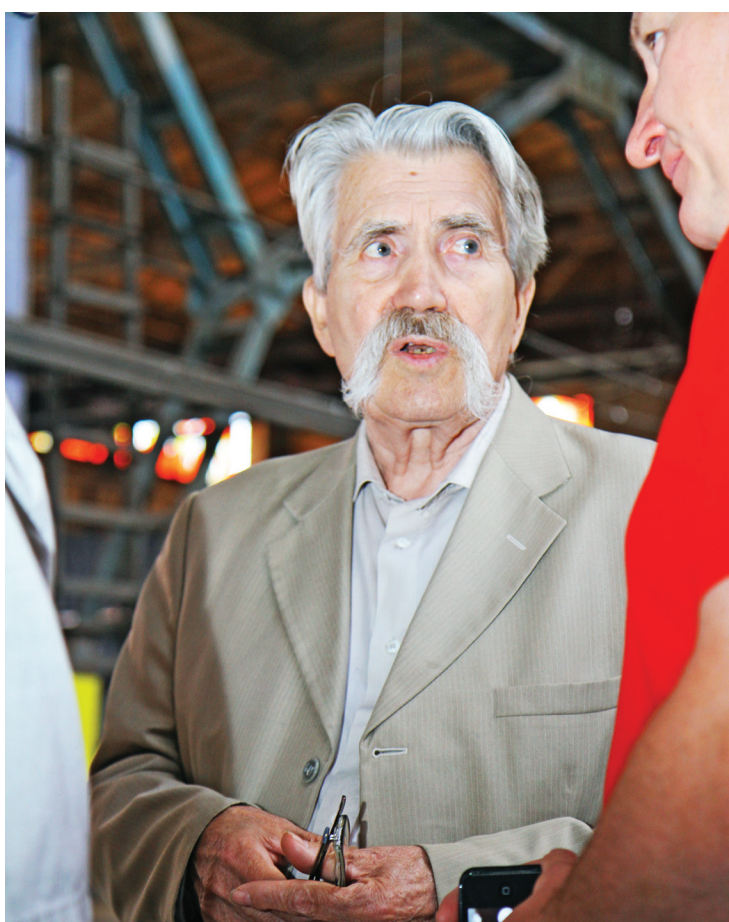
Левко Лук'яненко, український політв'язень, на презентації партії «ВОЛЯ»